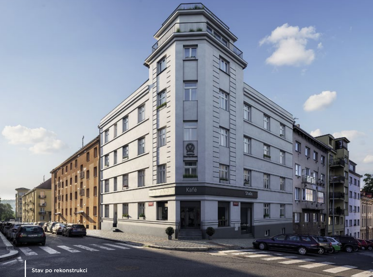
Stav po rekonstrukci